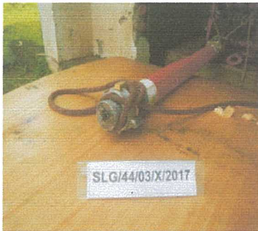
Uji Pecah ( Burst Test )