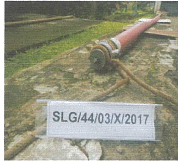
Uji Ketahanan ( Proof Test )