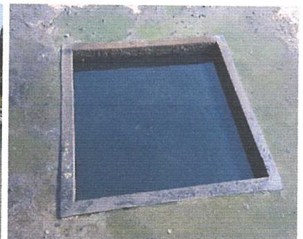
Pemadaman selesai/api padam